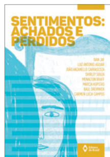
Editora do Brasil

Documentário que conta a trajetória da cartunista Laerte, refletindo como aconteceu a ascensão dessa artista e a coragem de se assumir mulher, depois de três filhos e muitos anos de carreira.